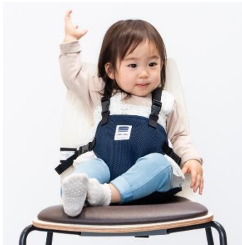
キャリフリー チェアベルト ショルダー&メッシュ 日本エイテックス株式会社