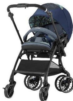
スゴカルSwitch コンビ株式会社